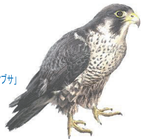
経ヶ岬周辺に生息する希少野生種「ハヤブサ」

や饗庭野演習場などの自衛隊基地の強化と結合して、近畿地方に一大軍事拠点を建設しようとするものです。私たちは、このような危険な軍事基地の建設を絶対に許すことはできません。